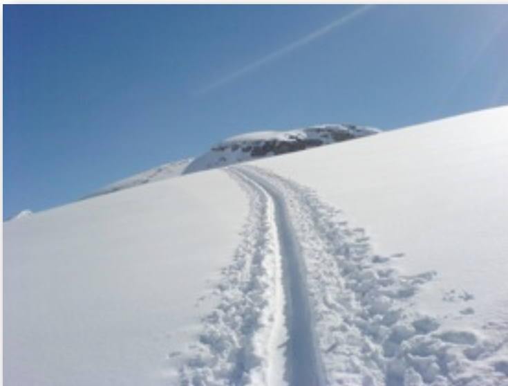
Aufstieg zum Daubenhorn