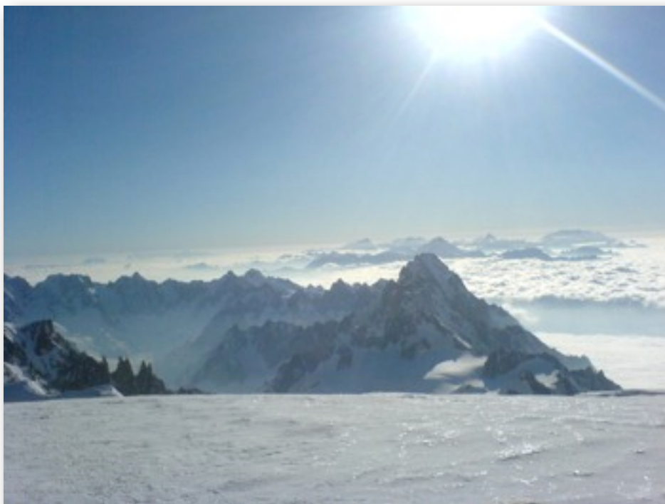
Im Aufstieg zum Mont Blanc